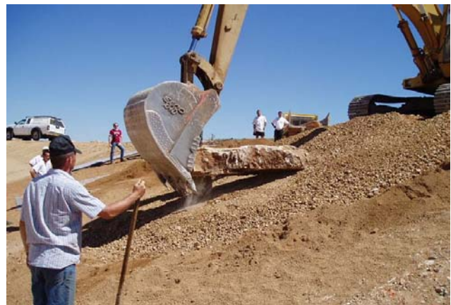
Figure 6. Planches d'essai : mise en place d'une dalle calcaire