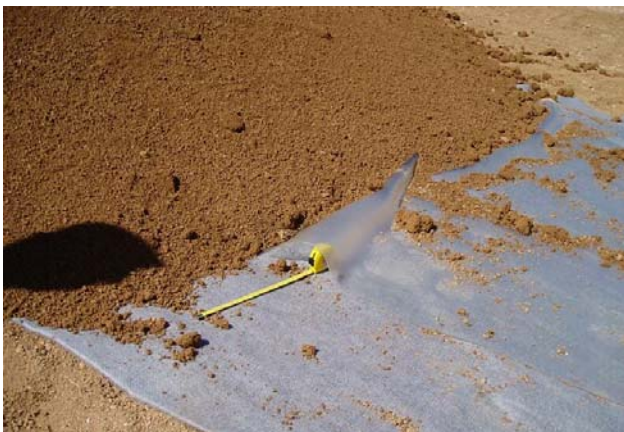
Figure 5. Planches d'essai : apparition d'un pli au pied de la planche d'essai