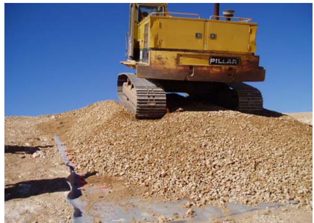
Figure 4. Planches d'essai : circulation de la pelle hydraulique sur le DEG