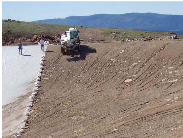
Figure 8. Ravinement et dégradation du support et du géotextile après l'orage

La difficulté d'utiliser des matériaux granulaires prélevés et préparés sur le site ne doit pas être sous-estimée : ainsi le matériau 0/6 mm prévu, concassé sur place s'est révélé contenir trop de fines et a dû être remplacé par un sable 2/6 mm provenant d'une carrière pour avoir un matériau suffisamment frottant et drainant entre la géomembrane et la couche de grave de la structure de couverture.