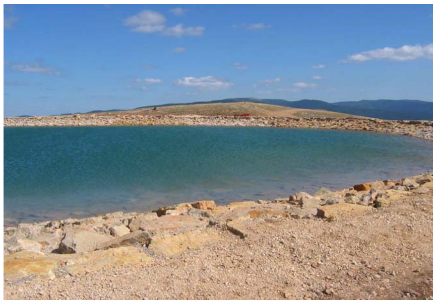
Figure 9. Vue du bassin en eau - Intégration dans le paysage