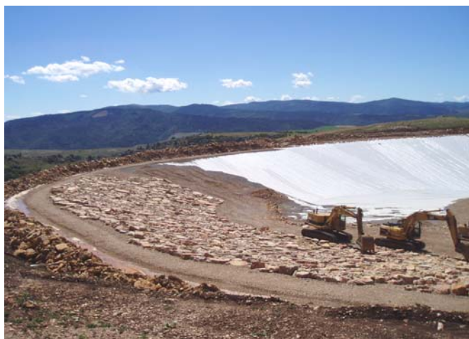
Figure 7. Vue du bassin en cours de réalisation