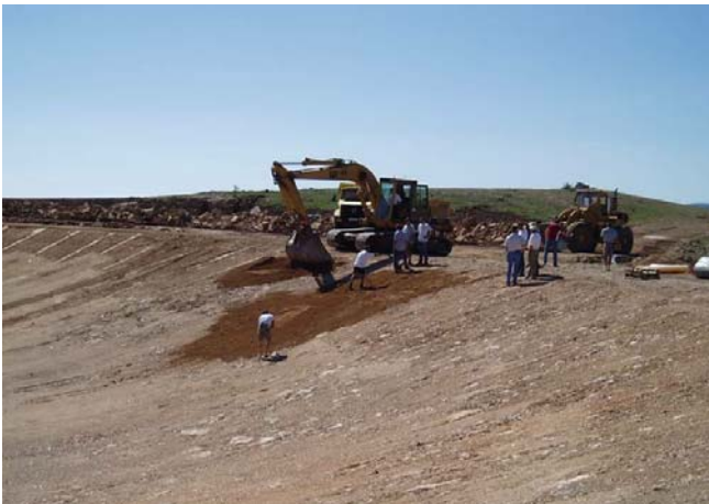
Figure 3. Planches d'essai : "surfaçage" du fond de forme à l'aide de sable

Des planches d'essais de convenance étaient prévues pour vérifier d'une part l'efficacité de la structure de couverture du DEG pour protéger la géomembrane vis à vis des sollicitations en poinçonnement lors de sa mise en œuvre et d'autre part sa stabilité sous les effets de la circulation des engins utilisés pour l'installation des matériaux sur le talus intérieur du bassin. 3 planches, de 5 m de long et 2 m de large, ont été réalisées les 9 et 10 juin 2004 (figures 3 à 6), sur un talus de pente 1/3 à 1/2,5 (V/H).