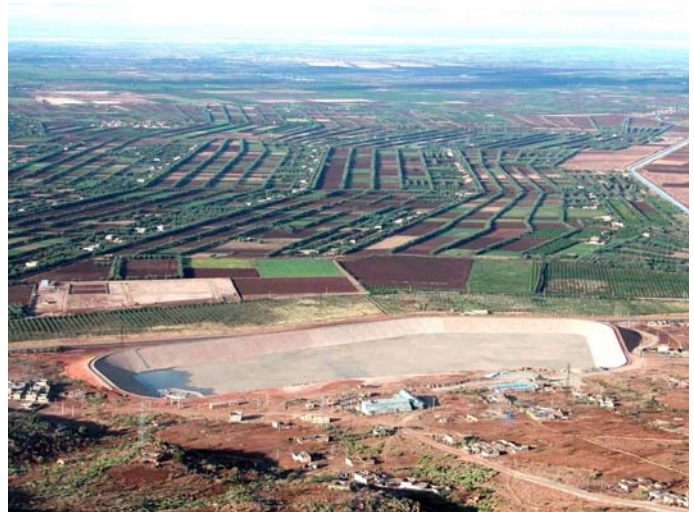
Figure 2. STEP d'Afourer – Bassin inférieur