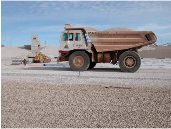
Figure 11. Planche d'essai lors d'une modification de granulométrie sur le fond (janvier et mars 2004). 80 passages avant examen