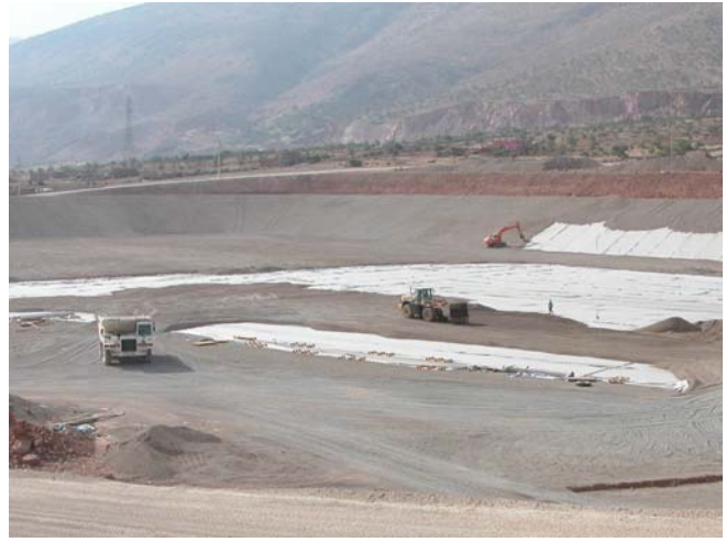
Figure 12. Mise en œuvre de la couche de confinement sur le bassin inférieur; dumper et chargeur sur le fond, pelle mécanique sur talus

Les essais de janvier et mars 2004 confirment que les granulats roulés (ici 16/32) ont une agressivité légèrement moindre que des agrégats concassés de dimension moitié (ici 8/16), ce qui confirme d'anciens résultats de laboratoire et de chantier. (Fayoux, 1990)