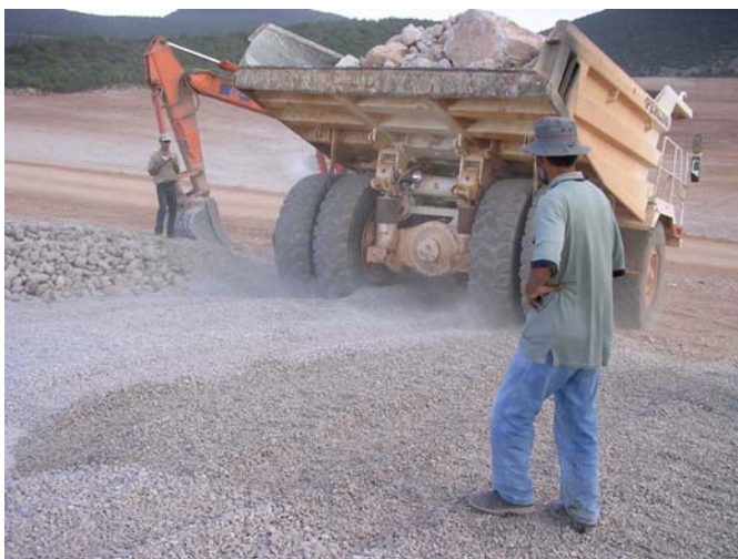
Figure 3. Planche préliminaire. Le dumper circule sur 0,20 m de gravier 5/16, sur un complexe formé par un géotextile, une géomembrane PVC 1,2 mm et un géotextile posée sur une couche de 5/20