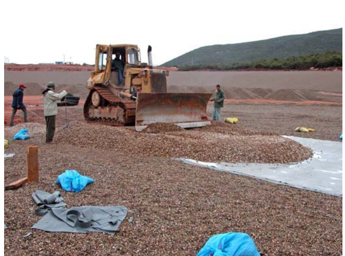
Figure 9. Planche du 22/11/2003. Mise en place sur le fond (gravier roulé 16/32). Solution retenue, ainsi que l'emploi de chargeur à pneu et de niveleuse