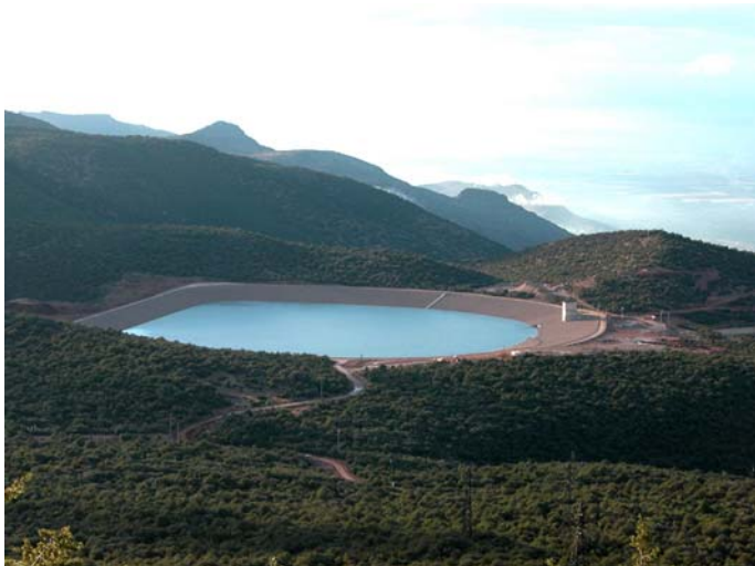
Figure 1. STEP d'Afourer – Bassin supérieur

Le bassin inférieur est coincé entre le pied de la montagne et un canal d'irrigation. Il a une forme très allongée, avec une longueur d'environ 650 m (crête à crête) et une largeur comprise entre 220 et 280 m. Il est semi enterré, par creusement dans une brèche calcaire et fermé, sur pratiquement trois côtés, par une digue d'environ 1000 m de longueur et de hauteur maximale 15 m (Figure 2).