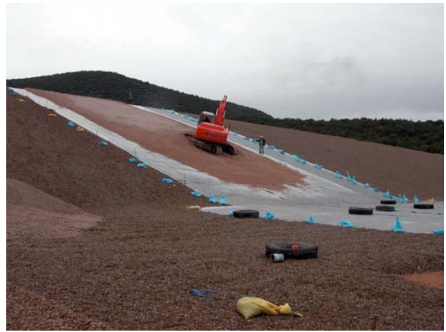
Figures 5 et 6. Planche du 22/11/2003 – mise en place sur talus d'une couche de transition de 0,20 m après réglage de gravier 5/16 concassé. Le support est un 5/16 roulé.