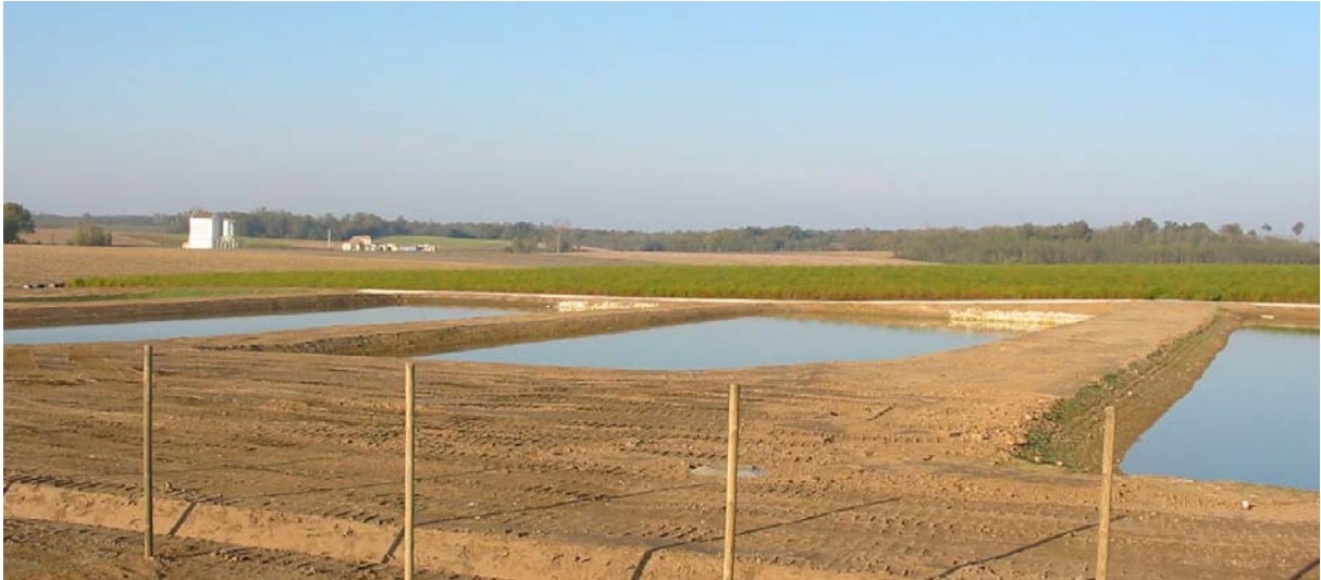
Figure 2. Vue des bassins à l'issue de la mise en eau suivant la réalisation

Afin de vérifier l'efficacité de l'étanchéité, une mise en eau des bassins réalisée à l'eau claire avec une hauteur initiale de 1m environ a été réalisée en novembre 2004. La figure 2 montre les trois bassins à l'issue de la réalisation et au début de cette phase d'essai d'étanchéité. Les relevés des niveaux d'eau des trois bassins sont présentés à la figure 3. Cette dernière met en évidence le mauvais fonctionnement de l'étanchéité puisque les trois bassins qui devaient être imperméable sont presque intégralement vidés en l'espace de deux mois.