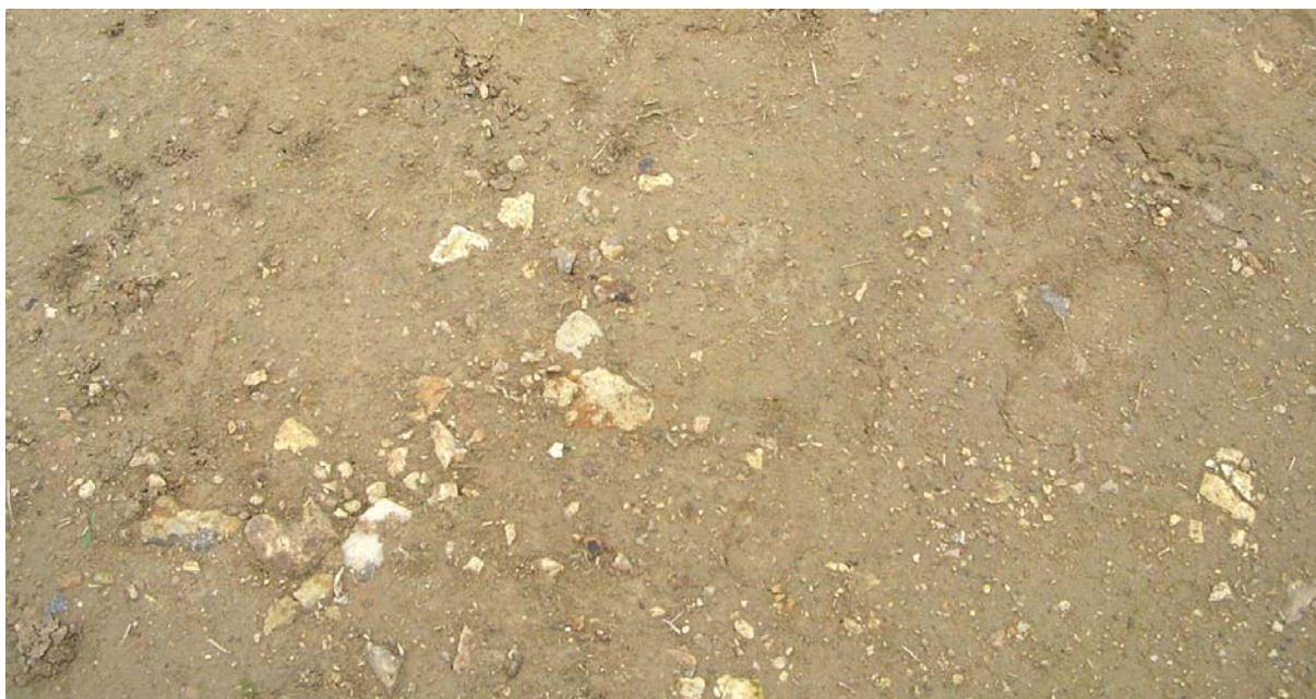
Figure 5. Silex dans la couche de confinement du GSB à la périphérie du bassin 2