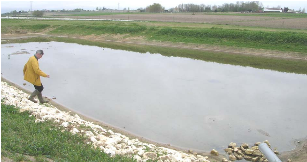
Figure 4. Observation de l'état du bassin 3, 5 mois après la mise en eau

La nature calcaire du substratum constituant le fond de forme de pose du GSB a aussi pu contribuer à modifier les caractéristiques de la bentonite sodique naturelle constitutive du GSB. Des prélèvements de GSB ont donc été réalisés pour analyse.