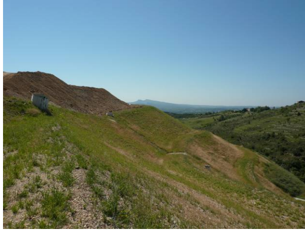
Figure 9. Couverture après végétalisation