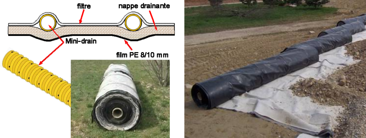
Figures 1 et 2. Description du géocomposite de drainage et d'imperméabilisation

Le géocomposite est présenté sur les figures 1 et 2. Les rouleaux ont une largeur de 4 m.