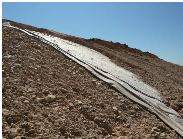
Figure 8. Mise en œuvre de la terre végétale

La couche de terre végétale est mise en œuvre sur la couverture géosynthétique sur une épaisseur de 0,3 m (figure 8).